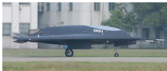
Le UCAV chinois

La Chine vient de dévoiler une photo de son premier drone sans pilote de combat aérien (Unmanned Combat Aerial Vehicle : UCAV). Ce drone ressemble étrangement au drone de la Marine US, le X-47B fabriqué par Northrop Grumman ou bien le Neuron européen.