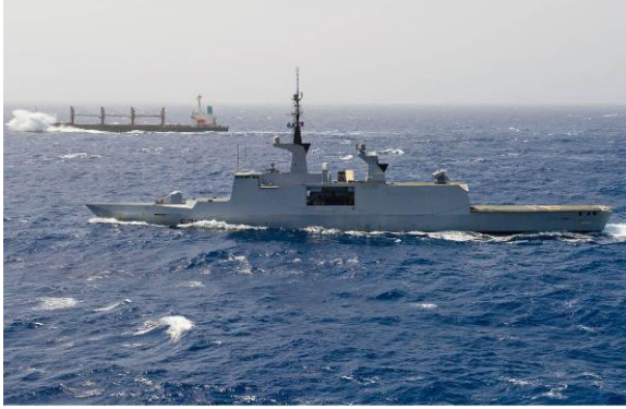
Le Guépratte escortant un navire de la PAM

mission d'escorter les navires du Programme Alimentaire Mondial (PAM), de participer à la sécurité du trafic maritime et de contribuer à la dissuasion, à la prévention et à la répression des actes de piraterie au large des côtes somaliennes. Depuis le 6 avril 2013, la TF 465 est placée sous le commandement portugais du commodore Jorge Novo Palma (CTF), embarqué à bord de la frégate lance-missiles portugaise Alvarès Cabral.