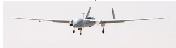
Le drone Harfang