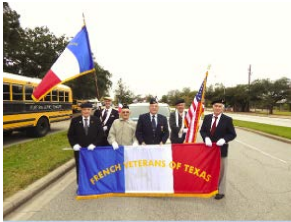
Préparation au défilé Le temps est gris et maussade Le vent n'est pas encore levé