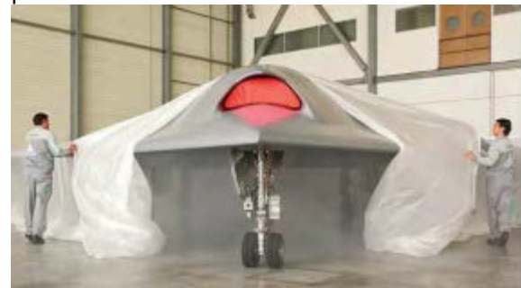
Le Neuron, drone de combat, de Dassault

Le DRAC a une envergure de 3,4m, et une vitesse maximale de 90km/h. Mis en œuvre par un opérateur qui le lance à la main, il est piloté à distance rapprochée par un opérateur de contrôle, tandis qu'un autre opérateur analyse les informations reçues. Avec une endurance de 5 heures de vol, son altitude de travail est entre 100 et 300m.