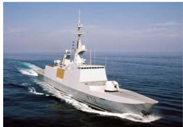
Frégate Légère Furtive « Courbet » du type La Fayette