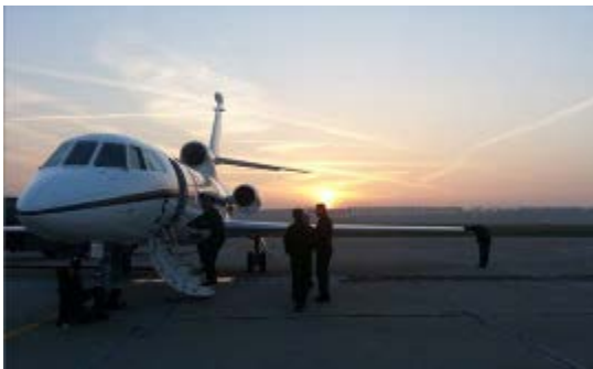
Avion Falcon 50 Marine

Le 13 novembre 2014, un avion Awacs et un avion Falcon 50 Marine français ont effectué des missions de surveillance aérienne au-dessus de la Roumanie et de la Baltique. Ces missions s'inscrivent dans le cadre des mesures dites de « réassurance » décidées par l'OTAN au profit des alliés d'Europe centrale et du Nord depuis le début de la crise ukrainienne. Au titre de ces mesures, un avion de patrouille maritime Falcon 50 de la Marine nationale, est déployé depuis le 2 novembre à Gdynia, au Nord de la Pologne, pour participer à la surveillance du trafic maritime en mer Baltique. Un avion Awacs de l'armée de l'air a par ailleurs effectué une nouvelle mission de surveillance aérienne au-dessus de la Roumanie. Les Awacs effectuent depuis le mois d'avril des missions régulières de surveillance des espaces aériens roumain et polonais. Avec ce vol, 29 missions de surveillance, en Pologne et en Roumanie ont ainsi été réalisées au départ de la base aérienne d'Avord.