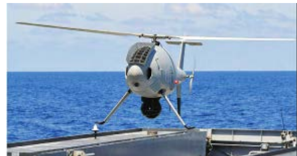
Essais du drone hélicoptère Schiebel S-100

Les drones de demain s'inventent et sont en essai aujourd'hui.