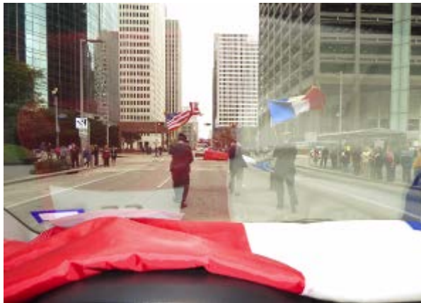
Photo prise à travers le pare-brise tout en conduisant Le vent s'est levé, il fait un froid de canard alors que nous étions en short et chemisette une semaine au préalable. A noter une assistance réduite frigorifiée.