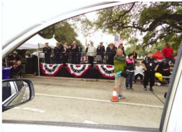
Par la lucarne de la vitre avant de la voiture, photo prise tout en conduisant. On aperçoit sur la tribune des dignitaires, en jaquette blanche, notre Consul Général saluant de son bras droit notre équipe. À sa gauche la Vice-consule.