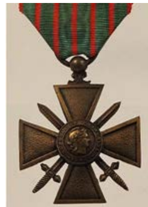
A noter cette Croix de Guerre sur son plastron