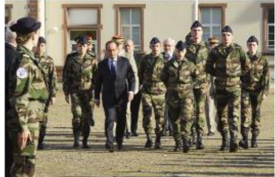
François Hollande et Jean-Yves Le Drian au premier centre du Service Militaire Volontaire

Le jeudi 29 octobre, François Hollande, président de la République, avec Jean-Yves Le Drian ministre de la Défense, ont inauguré le 1 er centre du Service Militaire Volontaire (SMV) à Montigny-lès-Metz en Moselle. Ce centre accueille depuis le 15 octobre dernier les 90 premiers volontaires (dont près de 30% de filles). Deux autres établissements ouvriront leurs portes dans les mois à venir : celui de Brétigny-sur-Orge (Essonne) le 3 novembre, celui de La Rochelle (Charente-Maritime) le 13 janvier 2016. La montée en puissance rapide du dispositif est une réussite avec 242 candidatures réceptionnées au centre lorrain, plus de 210 au centre d'Ile-de-France et une centaine à celui de Poitou-Charentes. Les postulants ont entre 18 et 25 ans, sont peu ou pas diplômés, très majoritairement issus de la région d'implantation du centre.