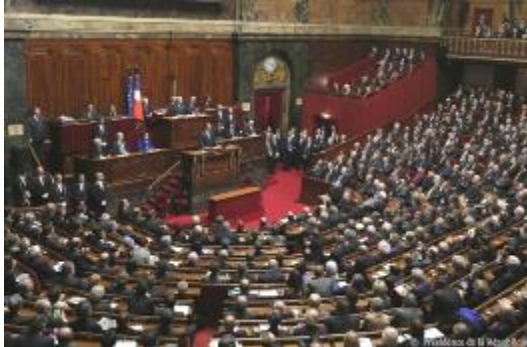
Discours du président de la République Devant le parlement à Versailles le 16 novembre 2015

baisse des effectifs prévue au sein de la Défense sera gelée jusqu'en 2019. « Cette réorganisation de nos armées se fera aux bénéfices des unités opérationnelles, de la cybersécurité et du renseignement », a-t-il détaillé. François Hollande souhaite également tirer « un meilleur parti des possibilités de la réserve de la Défense », rappelant que « les réservistes sont un élément fort du lien entre l'armée et la nation ». Il a évoqué le fait que les réservistes pourraient, dans l'avenir, former « une garde nationale encadrée et disponible ».